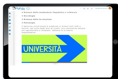
Dopo il diploma