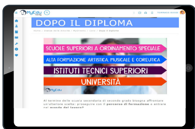
Sezioni di approfondimento