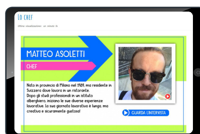
Interviste ai professionisti