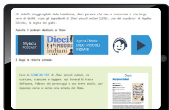
DIECI PICCOLI INDIANI