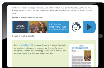
HARRY POTTER E LA PIETRA FILOSOFALE